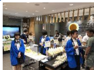
新宿での販売活動