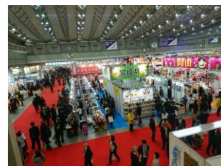
首都圏での展示見本市