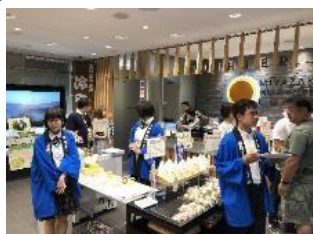
新宿での販売活動