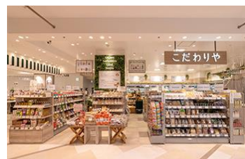
県産品取扱小売店等視察