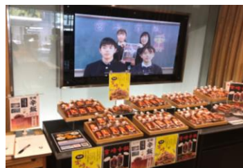
アンテナショップでの販売活動