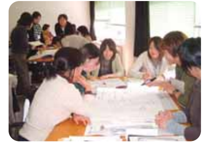
「地域連携看護」の研修風景

県立病院では、より専門的で質の高い看護を提供する看護師育成を目的に『専門領域コース』を設けています。「感染看護」「皮膚・排泄ケア」「緩和ケア看護」「救急看護」「糖尿病看護」「リエゾン精神看護」「がん化学療法看護」「地域連携看護」の8つの領域の研修を実施しており、受講生は、各病院のリソースナースとして看護実践モデル・指導的役割を果たしています。