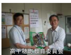
高千穂町教育委員会