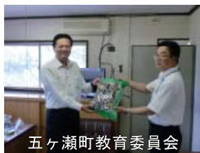
五ヶ瀬町教育委員会

6月6日、9日に高千穂町、日之影町、五ヶ瀬町の3町の教育委員会に、 西臼杵林業振興協議会 から地元で生産された 乾シイタケ が贈られました。