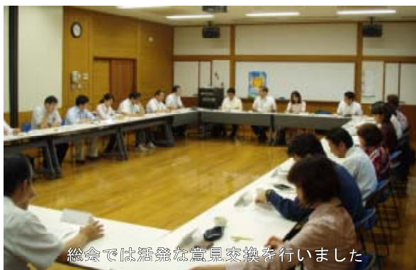
総会では活発な意見交換を行いました

6月16日、「みやざきの食と農を考える県民会議西臼杵支部」の総会が、西臼杵農業改良普及センターで開催されました。県民会議西臼杵支部では、 地域に根ざした効果的な食育・地産地消の推進 に取り組んでいます。