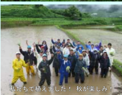
私たちが植えました！ 秋が楽しみ！

実りの秋 には、天岩戸神社に向かう県道7号線沿いに、 アートな水田 が出現します。お通りの際はどうぞご覧ください。