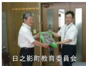
日之影町教育委員会