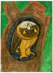
金賞 安在 陽(高千穂小)