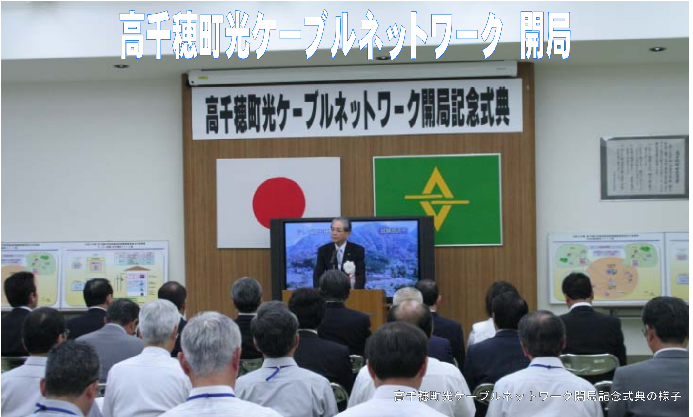
高千穂町光ケーブルネットワーク開局記念式典の様子

6月1日「電波の日」に、高千穂町役場において、高千穂町光ケーブルネットワーク開局記念式典が開催されました。