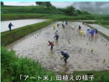
「アート米」田植えの様子

6月18日（土）、雨模様の中、高千穂町 中川登（なかがわのぼり）集落の棚田 で、「アート米」（景観用に開発された米の品種で、穂が出ると赤や黒などの絵柄に見える）の田植えが行われました。