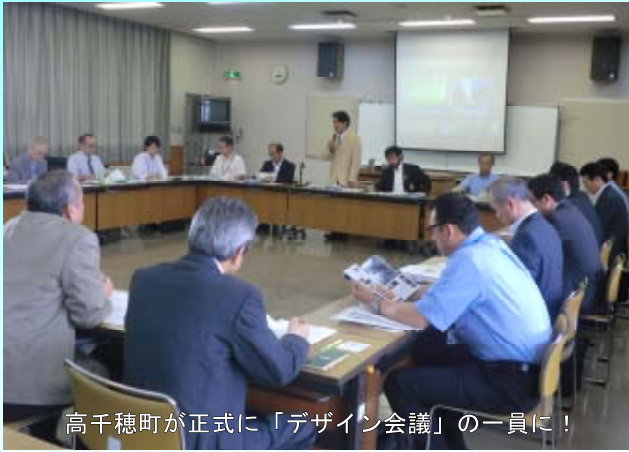
高千穂町が正式に「デザイン会議」の一員に！

国際競争力の高い魅力ある観光地づくりと、観光客の旅行回数・滞在日数の拡大をめざし、全国に48の観光圏が形成されています。