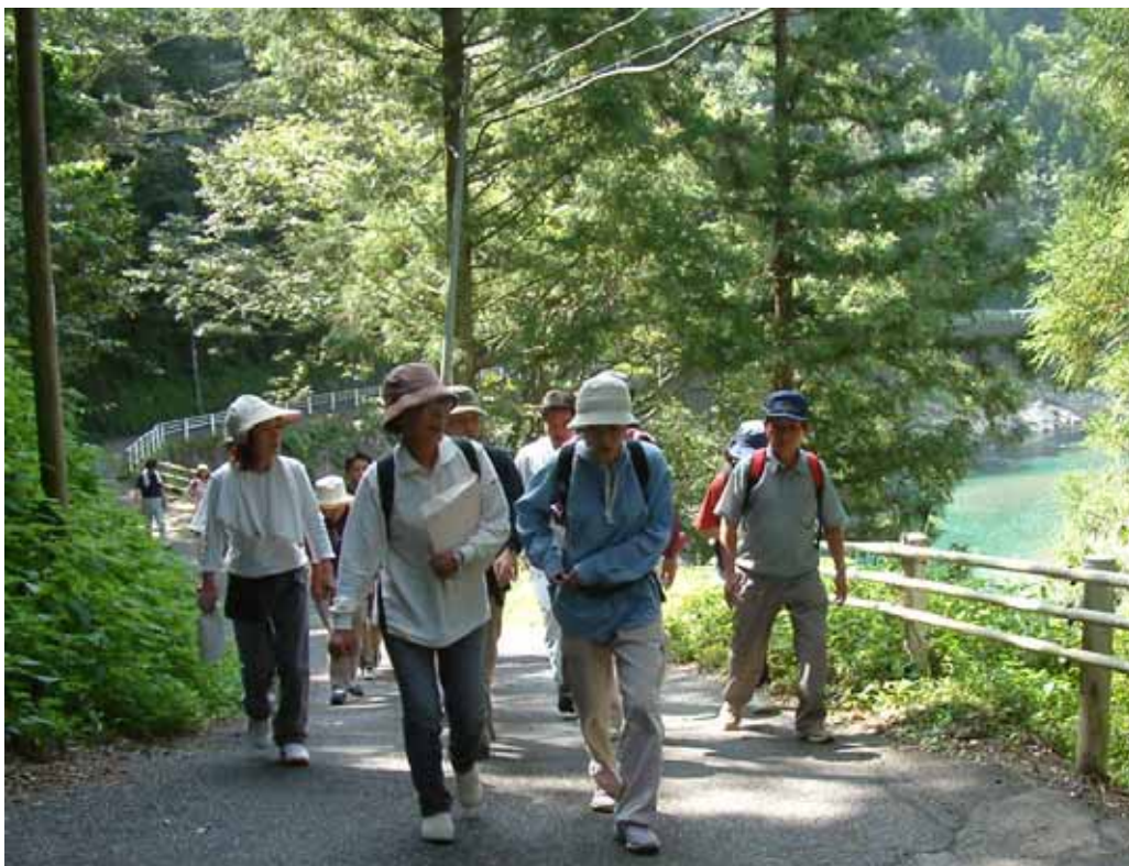
石垣の村トロッコ道ウォーキングコースを歩く参加者。途中ウォーキングや呼吸法等の指導もありました。

日之影町が森林セラピー基地 モニターツアーを実施 日之影町は、来年4月からの森林セラピー基地の ブランドオープンを前に、参加者の意見を聞くため のモニターツアーを、九月二十二日に実施しました。 町内外から十四人が参加。 今後は、宿泊を含んだモニターツアーが計画され ています。