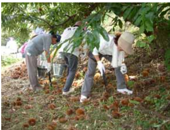
日之影町松の木地区の栗園で栗収穫を体験