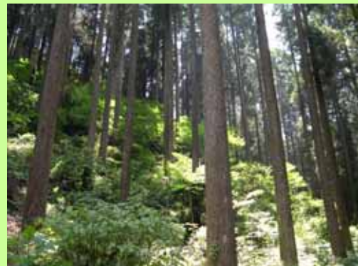
間伐後のイメージ(針広混交林への誘導)