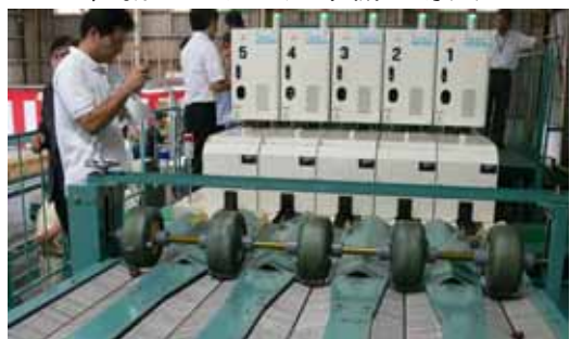
クリの内部の品質を測定することができるカメラの部分新たに導入された選果機は、光センサーによりクリ内部の品質を測定するカメラを備えており、外観だけで選果してきたこれまでに比べて更なる品質の向上が期待されます。

しかしながら、今後の高齢化に伴い、家庭選別作業が困難となることが予想されるため、選果レベルの向上と労力の軽減を図り、産地の維持拡大を図るため、新たにクリ選果機を導入しました。