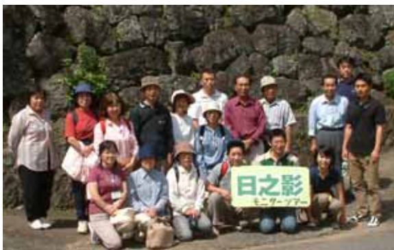
石垣茶屋の前で記念撮影

日之影町が森林セラピー基地 モニターツアーを実施 日之影町は、来年4月からの森林セラピー基地の ブランドオープンを前に、参加者の意見を聞くため のモニターツアーを、九月二十二日に実施しました。 町内外から十四人が参加。 今後は、宿泊を含んだモニターツアーが計画され ています。