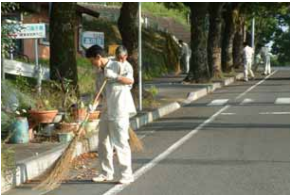
毎朝、県道北方高千穂線の道路清掃を行う（有）西臼杵浄化槽管理センターの皆さん

なお、同団体は、平成16年度から「ふるさとの道」愛護ボランティアの協定を西臼杵支庁との間で締結しています。