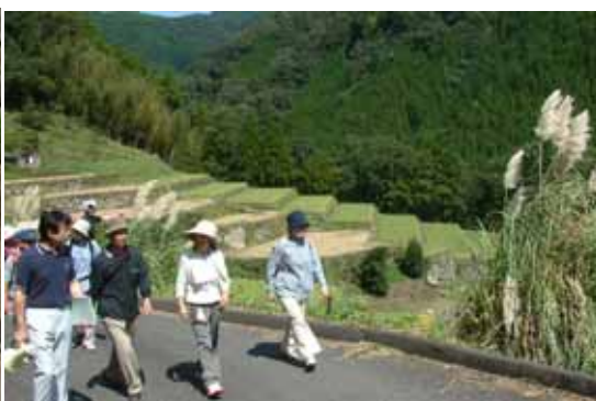
地元の方の案内により石垣の村を散策