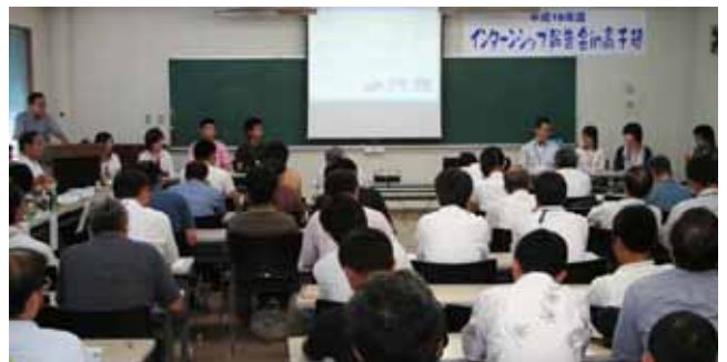
約100名の町民が参加する中で行われた「高千穂町地域づくりインターン活動報告会」（8月23日、西臼杵支庁大会議室）

報告会では、農泊の活用、観光事業者の団結、異業種との連携が重要な課題であること、インターネットの活用、歩いて楽しめる魅力を持つこと、まちづくりについて地域住民が議論することが必要などの提言がありました。