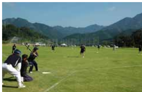
「癒しの森運動公園」のこけら落としとして開催された日之影町公民館対抗ソフトボール大会

同公園は、敷地面積約15haに、2001年度から6ヶ年計画で多目的グラウンドをはじめ、森林公園、周回ジョギングコース、遊具広場を整備してきました。来年3月のナイター照明施設の完成