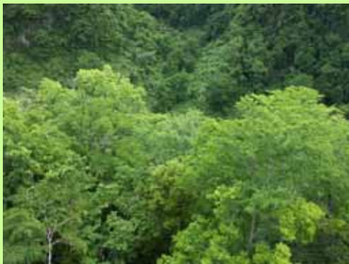
広葉樹の森づくりイメージ(広葉樹造林等)