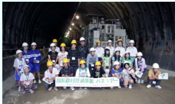
広域農道のトンネル掘削工事現場（高千穂町下野）

今回のバスツアーで参加者には普段見ることのない農業用施設を見ていただいて農業や農業農村整備事業に少なからず関心を持っていただけたかと思えます。