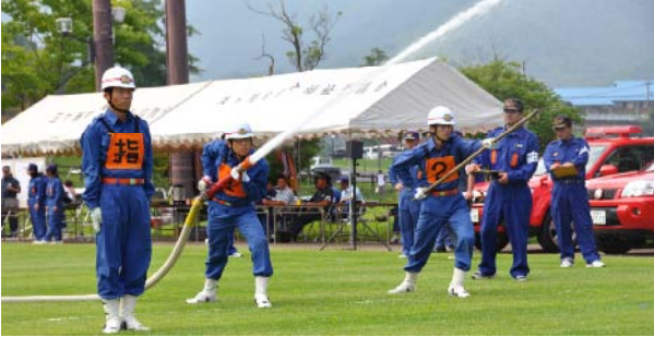
規律正しく競技を行う消防団員

競技の結果、自動車ポンプの部は高千穂町消防団機動分団第3部、積載車ポンプの部と小型ポンプの部は日之影町消防団第3分団第12部が優勝しました。