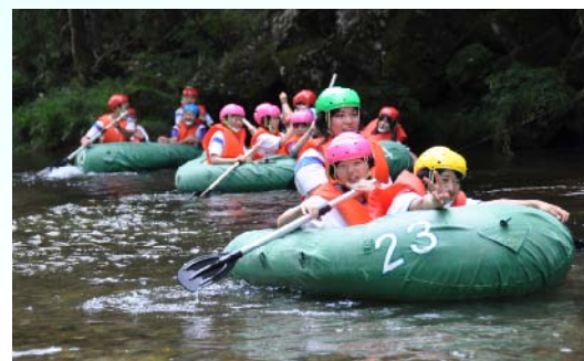
川下りを楽しむ生徒たち

1チーム3～4人の男女別3校混成で編成された23組が、協力してゴムボートを組み立て、救命胴衣やヘルメットを着けて、約2km、約1時間半の川下りを楽しみました。