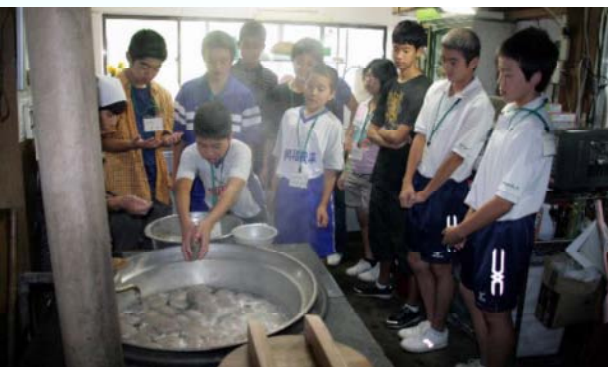
コンニャクづくり体験（日之影町戸川）