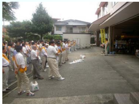
西臼杵支庁での一斉美化活動出発式の様子

期間中に限らず、国県道の美化活動が行われる際は、必要に応じてゴミ袋等の支給を行っていますので、お問い合わせください。道路を安全に美しく利用していただくよう皆様のご協力をお願いします。