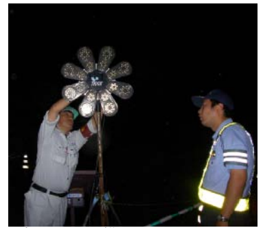
パトロールの様子

西白杵支庁土木課では、8月6日午後7時よりお盆前の道路パトロールを実施しました。特にお盆中は、帰省客、観光客等、道路事情に精通しない県外ドライバーが多数来訪することから、安全な交通を確保するための事前対策として、高千穂警察署、高千穂地区建設業協会の協力を得て行いました。