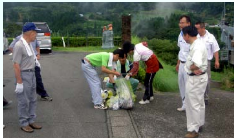
一斉美化活動の様子