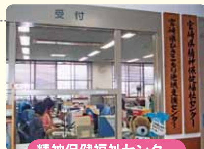
精神保健福祉センター