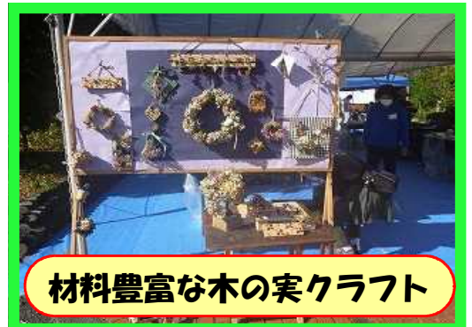
材料豊富な木の实クラフト