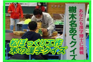
樹木名あてクイズ あなたも漢字博士に挑戦