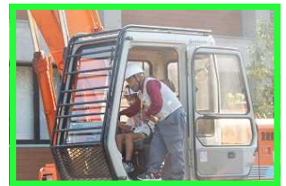
林業機械乗車体験