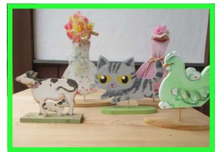
トールペイント教室