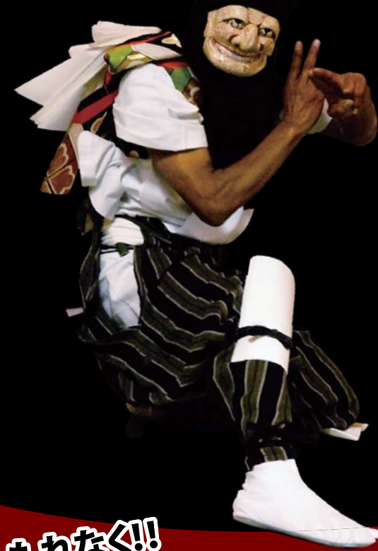
“YATSUBACHI” TAKACHIHO NO YOKAGURA