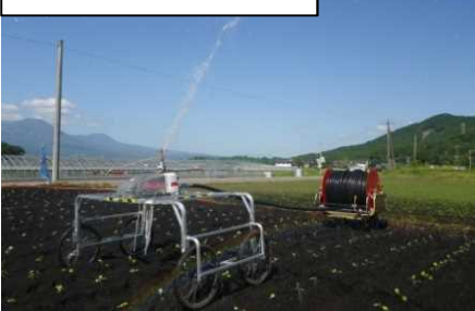
小型自走式散水機