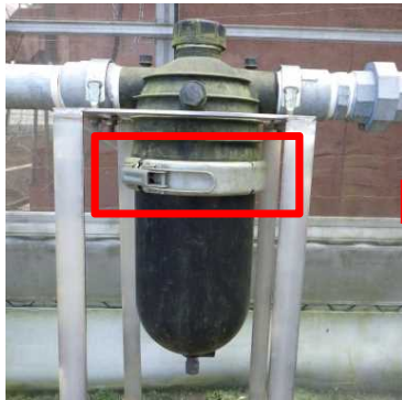
ストレーナーの外側の止め具を外して開ける

ストレーナーを使っていると内部のフィルターにゴミが付着するため、水圧が落ちて散布ムラが発生します。これを防ぐために、 定期的に中のフィルターを洗浄してきれいな状態を保ちましょう 。長期間ゴミが付着したままでは取れにくくなるので、栽培期間の始めと終わりには必ず洗浄してください。