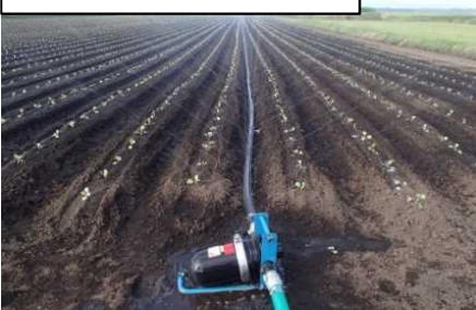
露地用散水チューブ