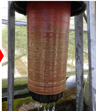
中のフィルターにはゴミが付着