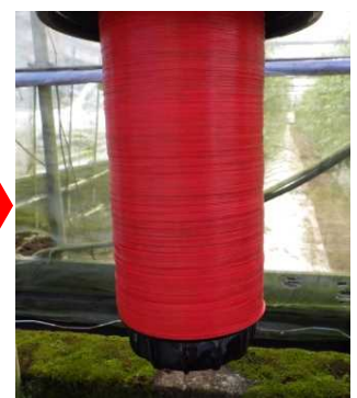
新品同様きれいになりました！