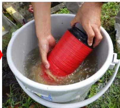
フィルターを外して洗浄 ※外れないタイプもあります