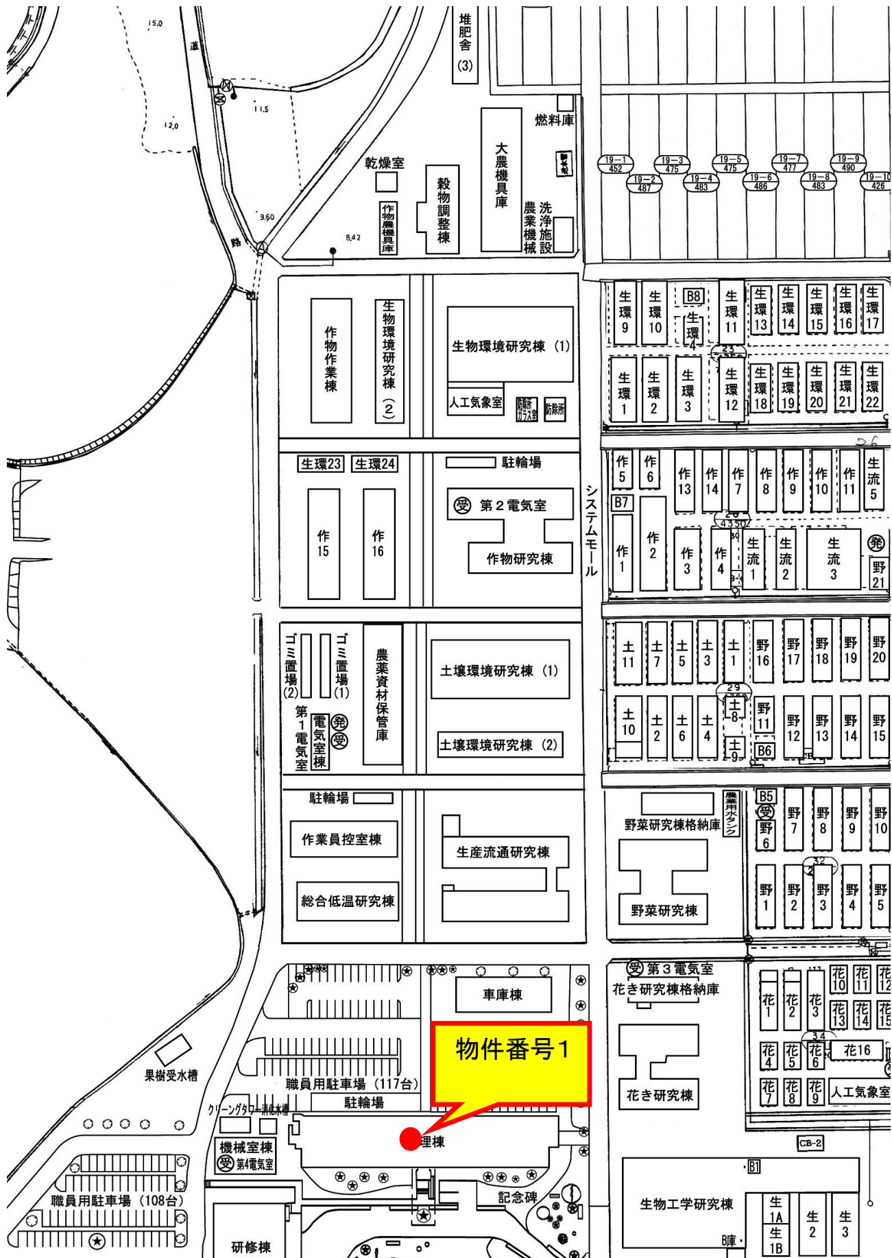
図1 総合農業試験場 自動販売機設置箇所図(全体)