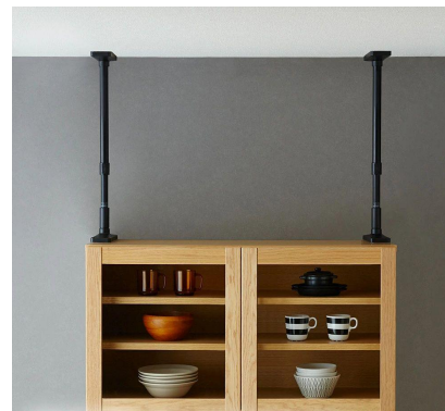
家具転倒防止器具