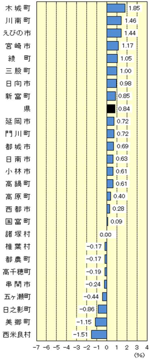
市町村別世帯増減率 (平成23年10月1日現在)