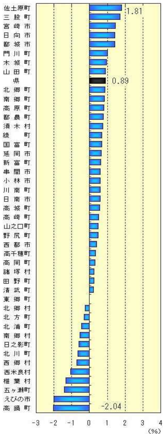
市町村別世帯増減率