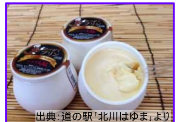
大ヒットコラボ商品「延学プリン」