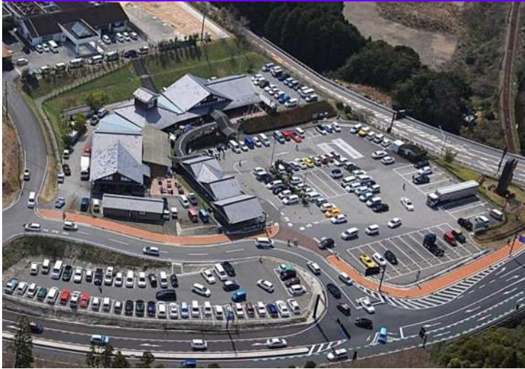
道の駅「北川はゆま」