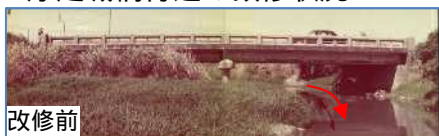
浮之城橋付近の改修状況