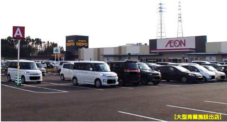
【大型商業施設出店】