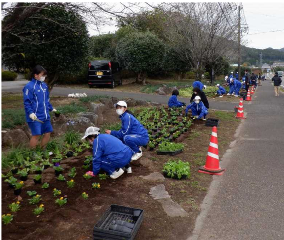
植栽状況 三松中1年生との協働 (国道268号：小林市水流迫地区)