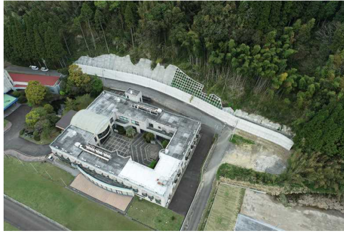
令和4年度完成 榎田ー1地区(急傾斜地崩壊対策事業)