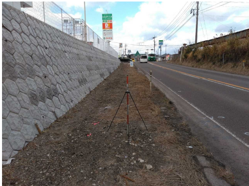
歩道工事(国道221号下麓工区 着手前)

沿道の美化については、沿道修景美化条例により指定された植栽地区の維持管理を行うとともに、沿道に草花の植栽を行い四季を通じて花のある美しい道づくりを推進している。