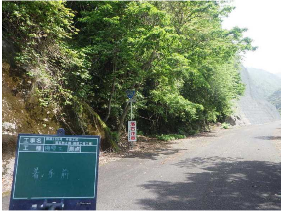
道路防災事業 (国道265号中原工区 着手前)