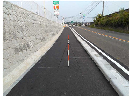
歩道工事(国道221号下麓工区 令和5年4月完成)