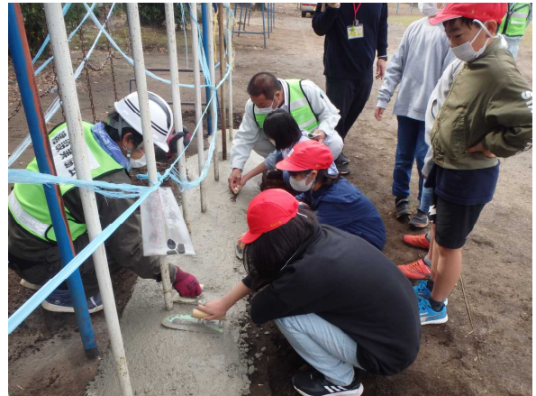
コンクリート補修体験の様子