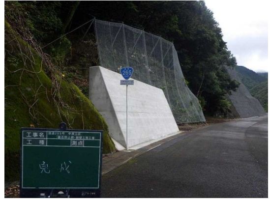
道路防災事業 (国道265号中原工区 令和3年度完成)