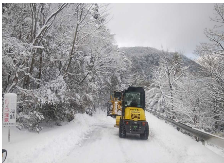
積雪時の除雪作業(県道小林えびの高原牧園線)