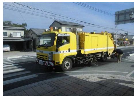
新燃岳噴火後の路面清掃(H29.10~)