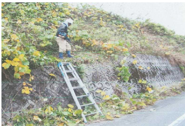
（鹿児島山有志会による法面除草作業）

県が管理する国・県道において、関係地区と協定を結び、周辺にお住いの皆様に道路美化活動や草刈活動を行っていただき、県は資材供給や報奨金により支援を行っている。