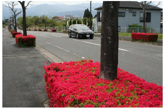
沿道のツツジ開花状況 (国道223号：高原町地区)