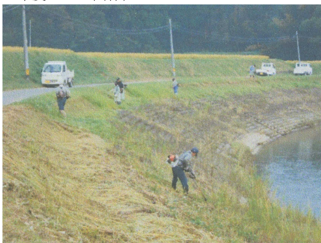
（ながえうらよくする会による草刈り作業）

自分たちの住む地域の川を積極的に守り育てていくために、関係地区と県がパートナーシップを組んで、周辺にお住いの皆様に県管理河川の草刈り等作業を行っていただき、県は報奨金の形でその支援を行っている。