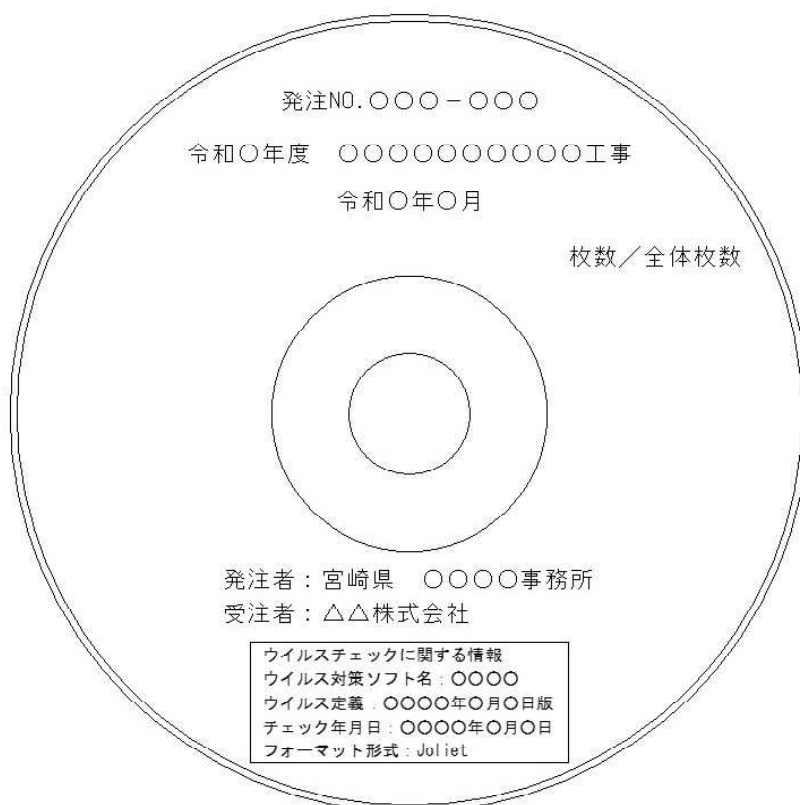
図1 電子媒体への表記例

受注者は、電子媒体をプラスチックケース、又は、A4ファイルにファイリング可能なケースに格納して納品するものとする。