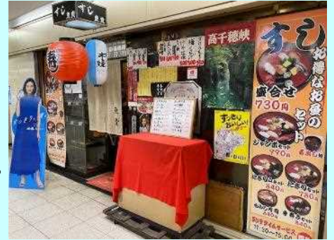
■大阪駅前第2ビル地下1階「すし魚貴」さん

そのようなビルの一角に大阪事務所はあるため、帰宅の際に地下へ降りたら、ニシタチに降り立ったようなもの…誘惑を無視して帰れない職員が多くいます。でも、サクッと飲んで帰るので、飲んで「山芋を掘る」ことはありません。