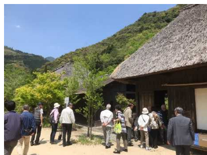
▲昨年度のふるさと訪問（西米良村）