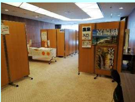
■第2回週末移住相談の会場（阪急グランドビル）

宮崎ひなた暮らしUIJターンセンター大阪支部では、以前よりご希望の多かった週末移住相談を開催しました。第1回は7月4日(土)に宮崎ひなた暮らしUIJターンセンター大阪支部で、第2回は8月2日(日)に阪急グランドビルにて個別の相談対応を行いました。