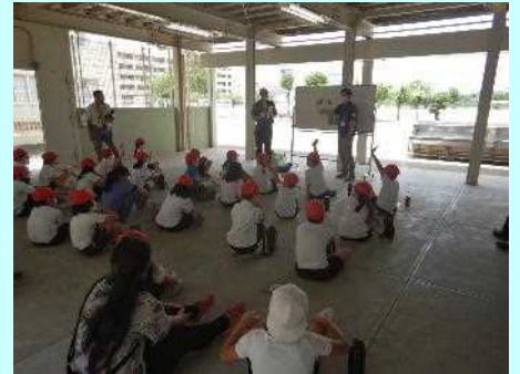
■きゅうり&ピーマンクイズ!