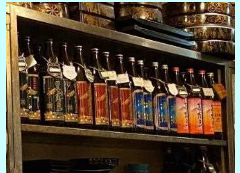
■店主さんが宮崎県出身で、宮崎の焼酎がずらり！

また、この地下街には宮崎ゆかりのお店もあるので、いつでも宮崎の焼酎を味わうことができます。そして、ここ以外にも新梅田食道街や京橋、難波をはじめ、大阪には数多くの「休肝日の敵」が待ち構えているのですが、節度ある飲酒を心掛けています。