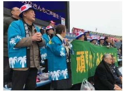
▲昨年度の全国高校駅伝の応援

の応援」があります。同窓会だけでは人数が限られているため、県人会、市町村会と一緒に応援することが大切です。