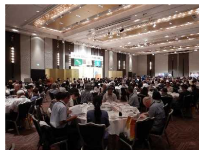
▲昨年度の近畿宮崎県人会総会

次に「総会」です。せっかく多くの会員の皆様が集まる場なので、何か一つでも「来て良かったな」と思ってもらえるように、宮崎県産品の販売や、郷土芸能の発表を実施しています。また、総会での挨拶ではあまりかしこまらずに、県人会の法被を着て宮崎弁で話すようにしています。