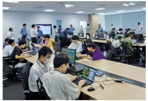
学生対象サイバーセキュリティコンテスト