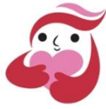
犯罪被害者等支援 シンボルマーク ギゅっちゃん