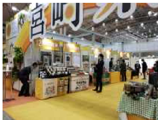
スーパーマーケット・トレードショー2022(幕張メッセ)