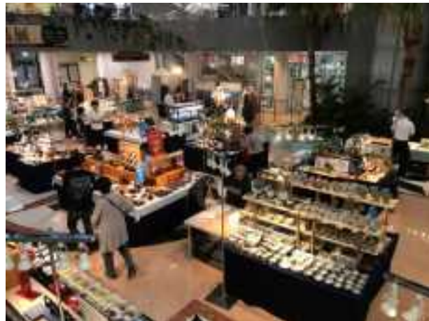
みやざきの工芸品展(宮崎ブーゲンビリア空港)