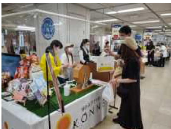
百貨店での物産フェア