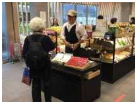
テストマーケティング