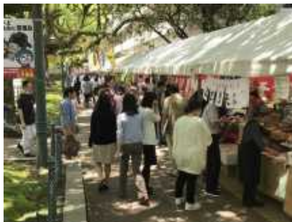
県庁楠並木通り KONNE 市