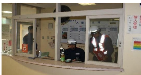
寮直室から災害出動指示

5月10日(木)、訓練課業終了後の18時00分に、「日向灘沖を震源とする大規模な地震により、宮崎市木花及び赤江地区に甚大な被害が発生」との想定付与により、屋内訓練場(体育館)を緊急消防援助隊のベースキャンプ地と見立て、30分間で個人装備品の準備を指示し、必要資機材等(仮眠場所・発電機・照明等)の設営を行いました。また、18時30分に「木崎浜に多数の傷病者があり、車両等の進入不可」の想定指令で、学校からランニングで木崎浜まで移動、その後、ダミー人形を徒手及び担架に收容、学校まで約5キロメートルの搬送訓練を行いました。夜間帯にも学校施設内での要救助者検索及び搬送訓練を行い、訓練は、翌朝5時に無事終了しました。