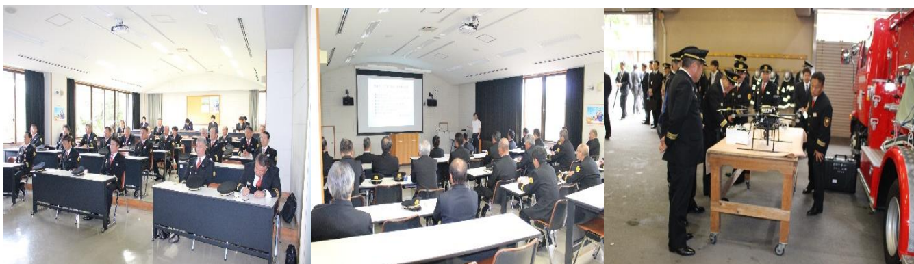
惨事ストレス研修および総務省消防庁無償貸与品確認

このような悲しい事故を二度と起こさぬよう、また、起こさせないように、消防学校としても安全管理教育の充実を図って参ります。