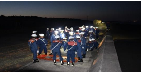
各小隊に別れ要救助者搬送準備