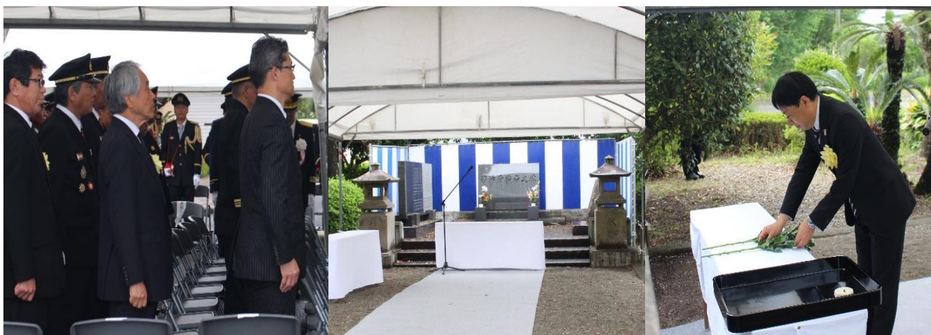
参列された河野知事