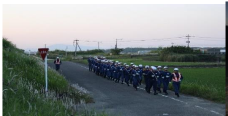
被災地へ駆け足行進で移動