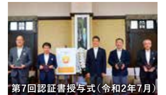
第7回認証書授与式(令和2年7月)

※申請書については、随時受け付けています。なお、申請から認証まで3ヶ月程度かかります。認証の有効期間は3年間です。