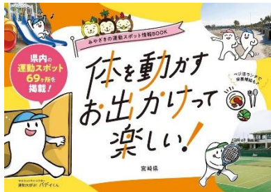
①みやざきの運動スポット情報 BOOK