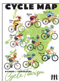
②九州・山口サイクルマップ