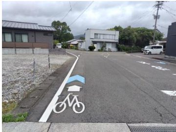
①矢羽根型路面標示の整備（日南市道）