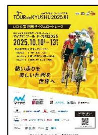
③マイナビ ツール・ド・九州2025