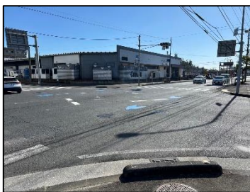
①自転車通行空間整備 (国道222号)