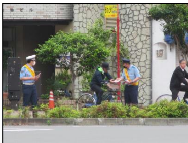
①交通安全の呼び掛け