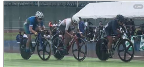
②国民スポーツ大会自転車競技