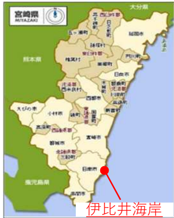
いびい 【伊比井海岸位置図】