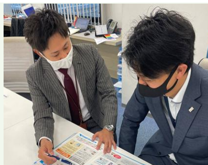
【充実した研修カリキュラムを用意】

個人代理店から企業代理店まで様々な代理店の売上貢献のために損害保険を中心としたソリューションの企画・提案する仕事です。 *個人向けの直接営業はありません。