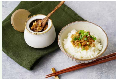
【現在開発中の商品】