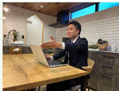
【打ち合わせの様子】