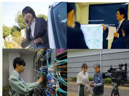
【各部署の仕事の様子】