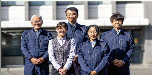
【増田工務店で働く仲間】