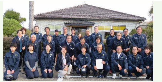
【創宮株の仲間たち】