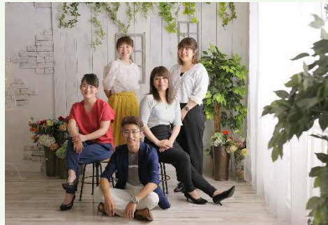
【フォトグラファーとコーディネーター】