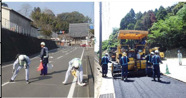
【測量・警備・舗装 現場写真】

建設（舗装）、測量、橋梁点検、地質調査、交通規制材レンタル、防犯設備リース、施設警備、雑踏警備、交通誘導警備、高速道交通規制