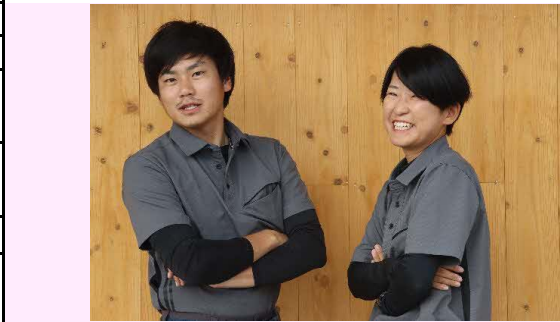
【我が社の若手ホープ】

建築・土木・舗装工事一式 インフラ整備・個人住宅・店舗、事務所の新築・リフォーム