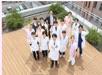
【宮崎中央眼科病院スタッフ】