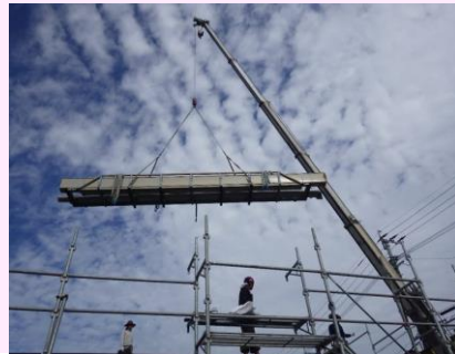
【建設現場で働く社員!!】

【事業概要】 特定建設業(土木・解体・建築・舗装工事業)産業廃棄物収集運搬・処分業