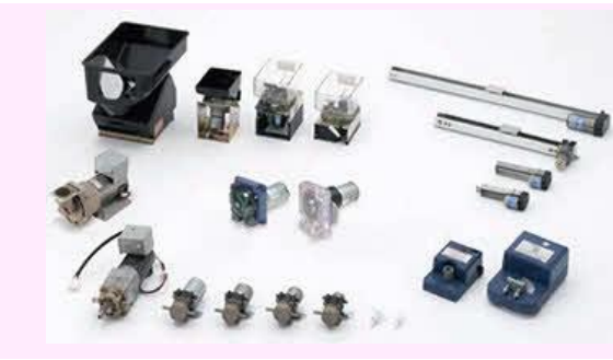
【コインホッパー、コーヒーミル等】

多品種・小ロット・短納期に対応するため、独自の生産計画システムや品目別のU字ラインを採用。5S（整理・清潔・清掃・整頓・躰）運動や作業改善、品質向上、短納期化、事務合理化を推進