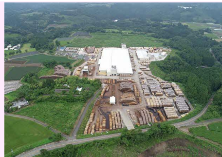
【最新鋭設備を導入した志布志工場】