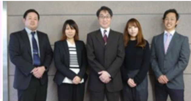
【代表取締役社長および各部署の担当者】

みやさん食品株式会社は冷凍食品製造・販売メーカーでございます。大手ピザチェーン店やコンビニ量販店の生産拠点として、年間4000トンにもおよび様々なコンシューマー・業務用冷凍食品を全国に届けています。