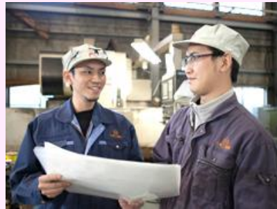
【作業打合せの様子】