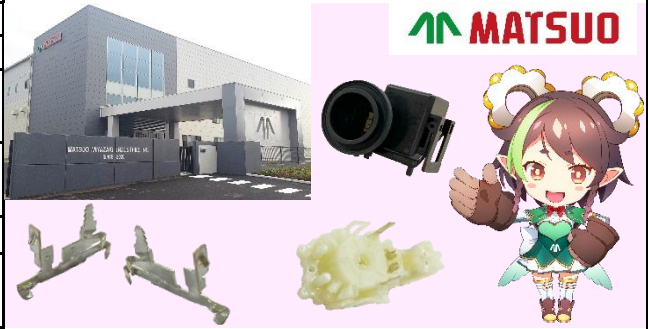
【会社の外観と製品】

○自動車用小型モーターに使用される部品 (プレス品、樹脂インサート成形品) の製造・販売