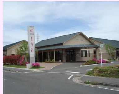
【特別養護老人ホーム】

【事業概要】 特別養護老人ホームを中心に介護保険7事業の運営、住宅型有料ホーム、サービス付き高齢者向け住宅の経営