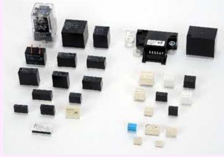
【弊社の製造リレー】