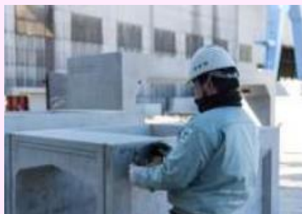
【弊社社員の仕事の様子】