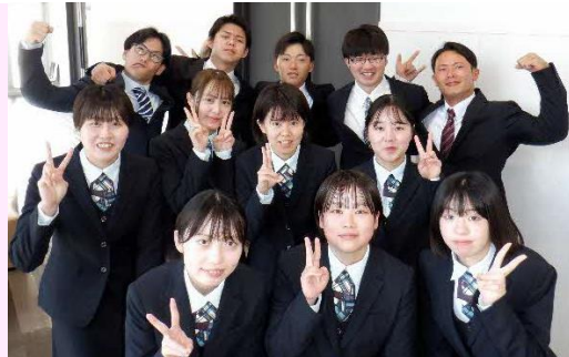
【宮崎の“応援団”として頑張ります。】

地元のお客様からお預かりした預金を地元で資金を必要とするお客様に融資を行って、事業や生活のサポートをする協同組織金融機関です。地元の中小企業者や住民と強い絆を形成し、地域経済の持続的発展に努めています。