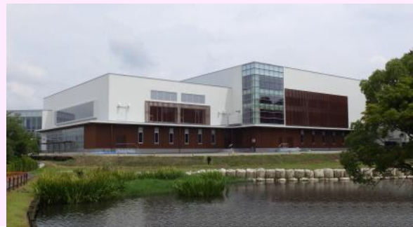
【早水公園サブアリーナ武道場建設工事】

都城市を中心に建設業(建築・土木・舗装・管工事等)一級建築士事務所・運送業を展開 都城市クリーンセンターやサブアリーナの建築工事 都城志布志道路や山之口陸上競技場造成工事など実績多数