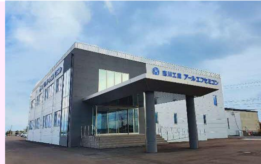
【宮崎本社新社屋外観】

1984年に創業し、宮崎本社では、半導体のテストハウス、半導体モジュール組立や、特殊素子の組立、基板実装。東京支社では、RFIDのデバイス設計・開発、関連製品のアプリケーション開発を行っています。