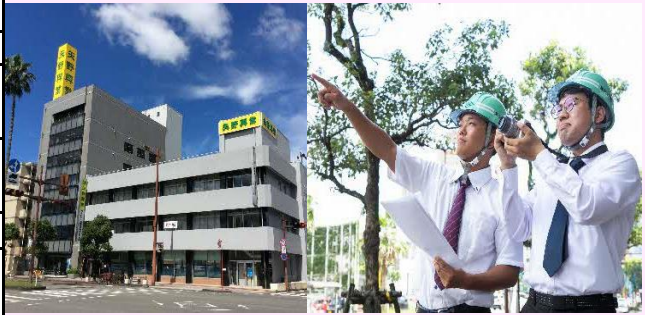
【矢野興業本社ビル・技術職員】