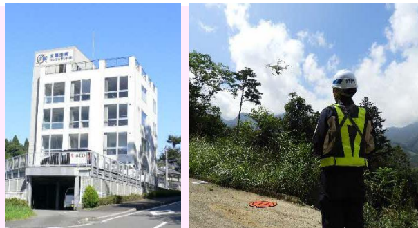
【本社(延岡)・現場(ドローン測量)】

国・県・市町村から発注された公共事業のお手伝いをしている会社です。仕事内容は、道路・河川・構造物等の設計業務、橋やトンネルの点検業務、地質調査や環境調査、測量業務等を行います。