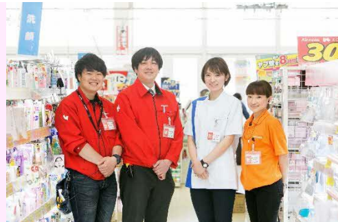
【弊社社員・パート・アルバイト】