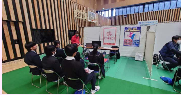
【市内高校生企業説明会】

ホームページURL https://www.21seiki-group.co.jp/