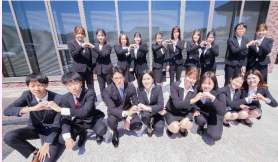
【2024年定期採用者集合写真】