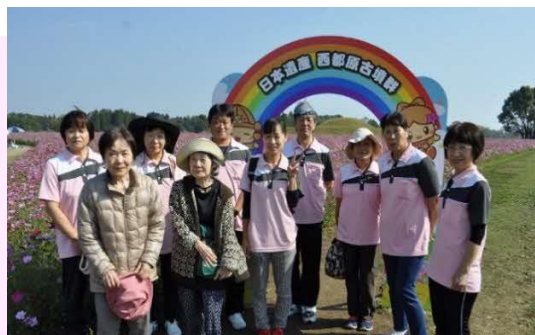
【ご利用者様とコスモス鑑賞にて】