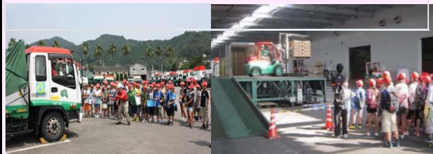
【子供交通安全教室、社会見学の風景】