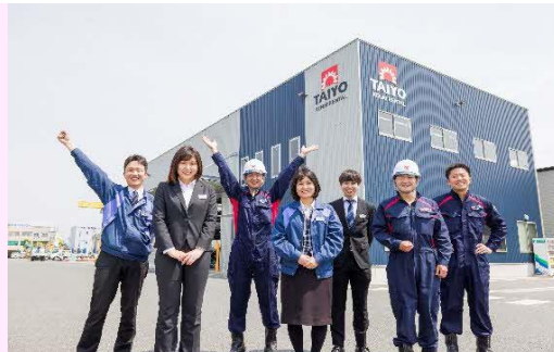
【支店で働く皆さん】

土木・建設機械器具、各種トラック・高所作業車、電気機械器具、プレハブ・コンテナハウスなどの総合レンタル業