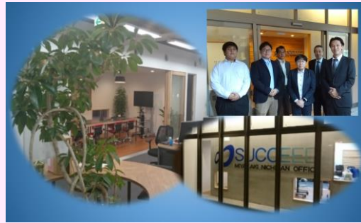
【日南事務所の風景】