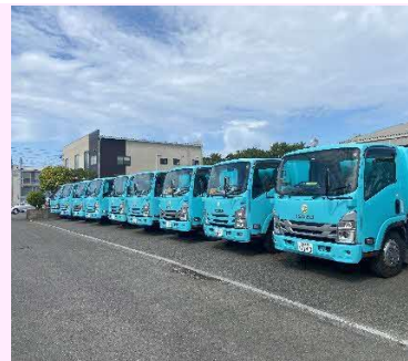
【弊社 ごみ回収車両】