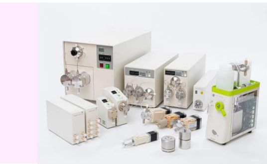
【ユニフローズの自社ブランド製品】

理科学機器・医用機器・省力化機器の設計、製造、販売 <マイクロポンプ、切替バルブ、脱気装置、ダンパ、その他HPLC (液体クロマトグラフ) 関連の装置および部品>