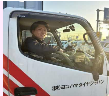
【ヨコハマタイヤ営業社員】

横浜ゴムが企画・開発・研究・製造するヨコハマタイヤ（乗用車用、トラック・バス用、産業車両用）をメインに営業活動（販売・マーケティング・卸売・サービス）を行っています。