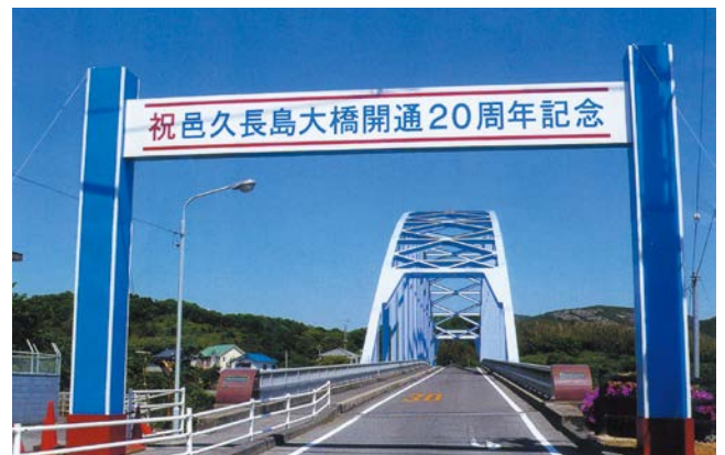
人間回復の橋と呼ばれる邑久長島大橋

長島と対岸の虫明を結ぶ邑久長島大橋は、1988年(昭和63年)に開通しました。隔離する必要のない証、人間回復の証として架橋され、現在は民間バスも乗り入れ、入所者も自由に島外に出かけられるようになっています。