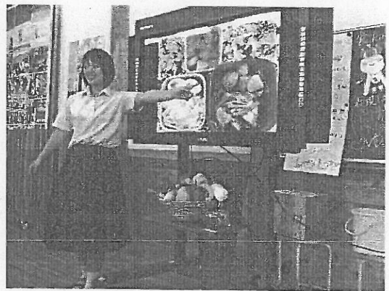
◆「みやざき弁当の日」の取組