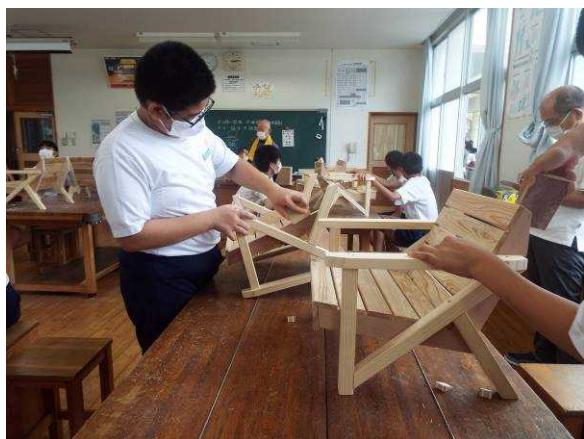
建築大工体験の様子