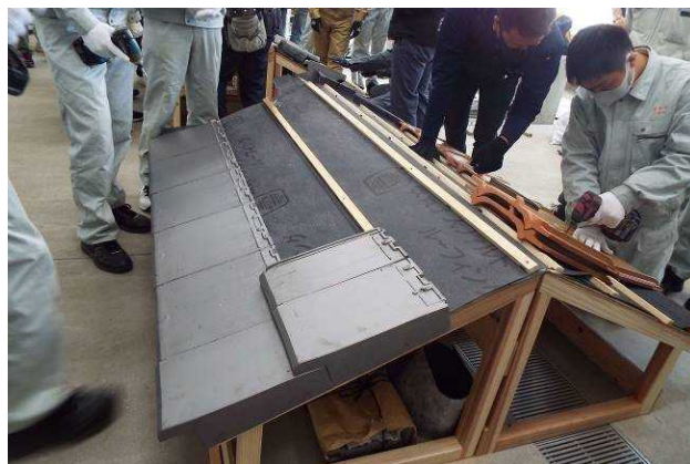
かわらぶき作業の様子