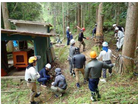
（林業架線作業主任者免許講習）

公益社団法人宮崎県林業労働機械化センター http://www.ringyokikai.jp