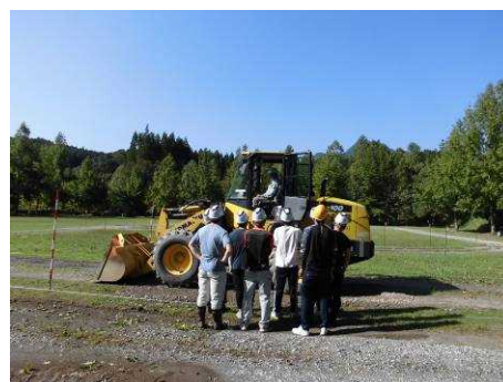
（車両系建設機械運転技能講習）