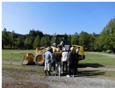
(車両系建設機械運転技能講習)