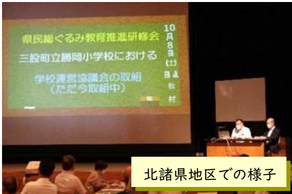
北諸県地区での様子

【感想等】『地域と学校の連携・協働の推進』のさらなる具現化を図るために、各地区の学校運営協議会のメンバー等で、情報交換を行いました。参加者からは、「連携の質をあげる重要性を感じた」「学校運営協議会を目標やビジョンを共有できる場にしていきたい」「目指すのはあくまでも地域とともにある学校づくり、改めて大切なことを再確認できた」などの感想をいただくなど、充実した研修となりました。 (北部教育事務所)