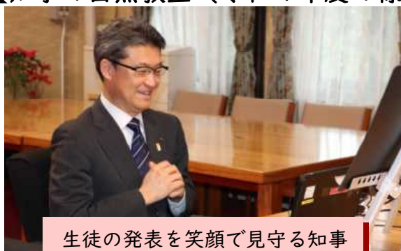
生徒の発表を笑顔で見守る知事