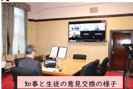
知事と生徒の意見交換の様子

「わたしたちの夢や希望」をテーマに、知事とみなみのかぜ支援学校高等部と清武せいりゅう支援学校高等部の生徒たちがオンラインで交流しました。「夢や希望」について生徒たちの発表を聞いて意見交換をしたり、生徒たちからの質問に知事が答えたりするなど楽しく充実した時間となりました。(県教育庁教育政策課)