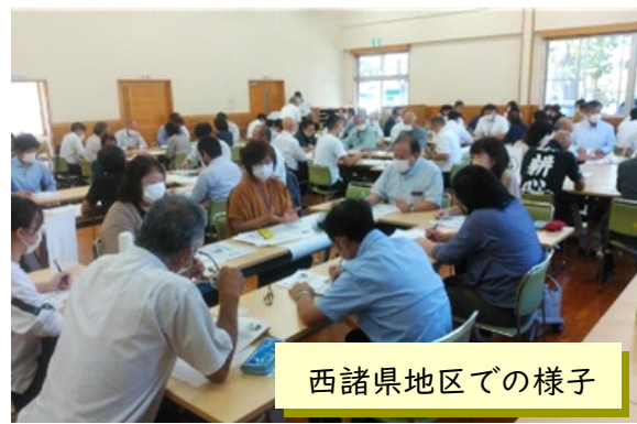
西諸県地区での様子

【内容等】「地域と学校の連携・協働推進」についての説明や実践発表、講話、ワークショップという内容で行いました。ワークショップでは、「子ども達の豊かな成長のために、私にできること・やってみたいこと」をテーマに、熱心な語り合いが行われ、会場は熱気に包まれました。土曜日に開催し、地域の方や保護者、教職員、南九州大学の学生、行政関係者等、北諸県地区・西諸県地区ともに100名以上のご参加をいただきました。 (南部教育事務所)