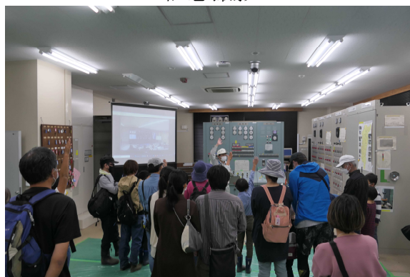
岩瀬川発電所見学