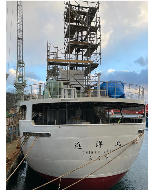
建造中の様子（外観）