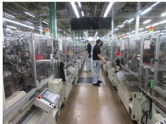
先端技術が搭載された超高速組付設備