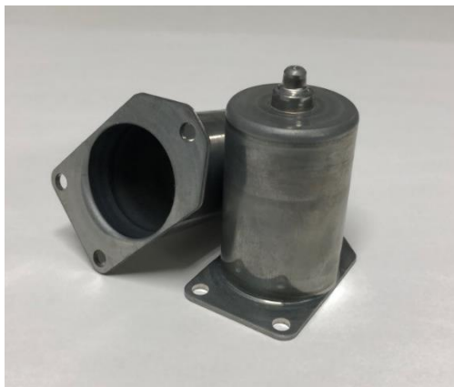
世界トップレベルの「加工技術」と「品質」

当社は自動車用電装品の世界トップメーカーであるデンソーグループの一翼を担う南九州の生産拠点です。独自の技術で高速・高精度加工を追求し高い品質と高い生産性を実現しています。そのオンリーワンの技術で生産された製品は全世界のお客様へ届けられています。