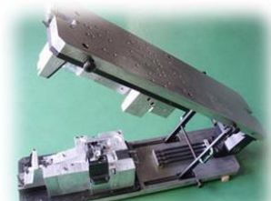
ロストワックス金型