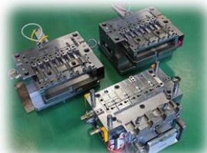
プラスチック金型