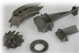
タービンブレード等 (ロストワックス金型)