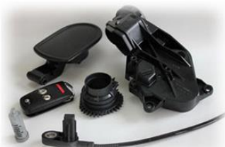
自動車関連製品 (プラスチック金型、ダイキャスト金型)

金型専門メーカーです。自動車向け樹脂、ダイキャスト金型、精密鑄造向けロストワックス金型と各種金型設計製作。