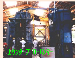
カウンターブローハンマー