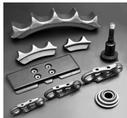
建設機械 足回り部品