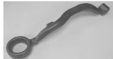
アームサスペンション (自動車足回り部品)