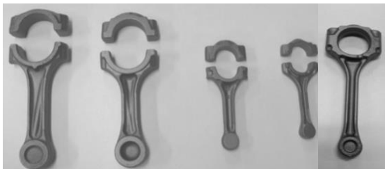
コンロッド (自動車エンジン部品)