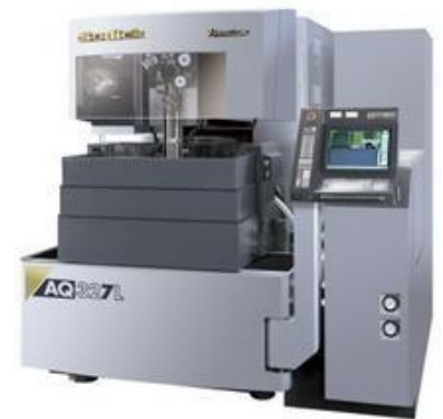
ソディック ワイヤー放電加工機 AQ327L