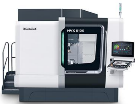
森精機 マシニングセンター NVX5100