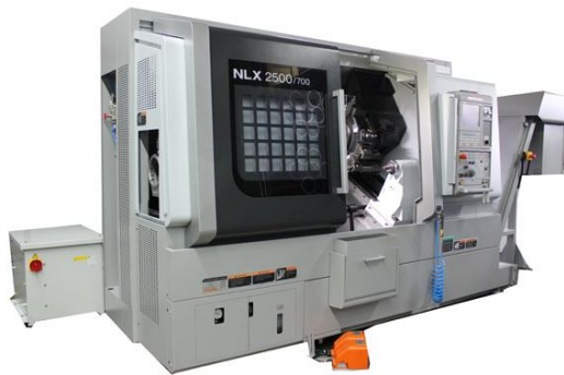
森精機 NC旋盤 NLX2500