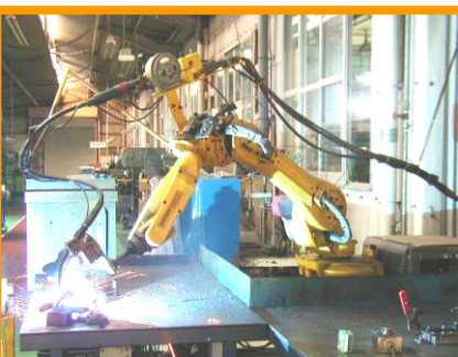
アーク溶接ロボット