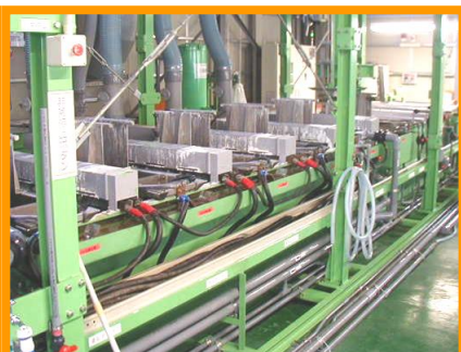
自動亜鉛めっきライン