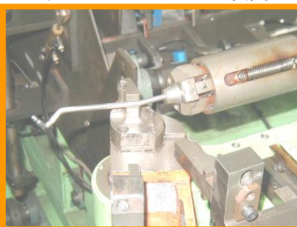
NCベンダー曲げ加工