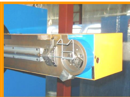
NCフォーミング曲げ加工