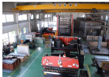
精密板金・製缶工場