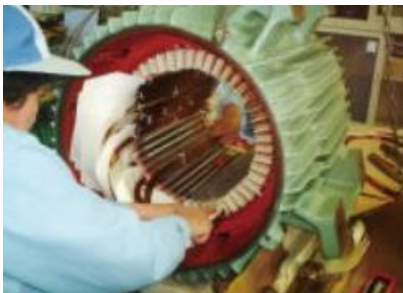
発電機・モーター点検・整備