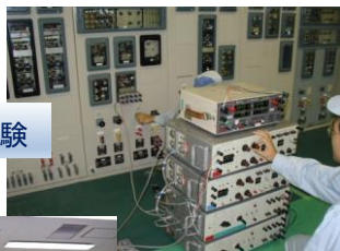
中央監視制御システム