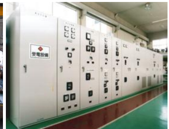
受配電盤・制御盤

お客様のモノづくりを支える電気・計装設備やシステムの安定稼働・効率化に関するあらゆる課題に取り組んでいます。