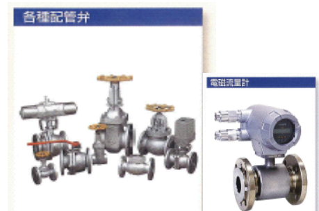
計装機器類の点検・整備