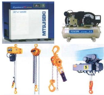
エアコンプレッサ/クレーンの 工事・点検・整備