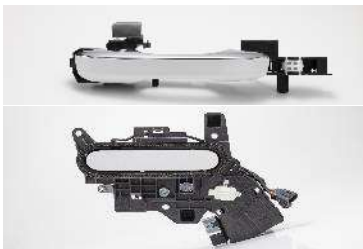
アウターハンドル