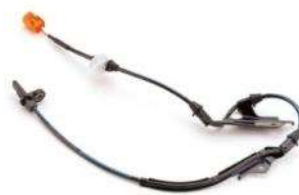
ABSホイールセンサー