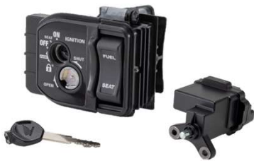
ステアリングロックASSY