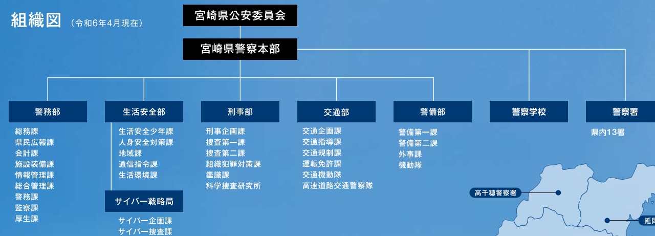
組織図 (令和6年4月現在)

「県民の期待と信頼に応える強くしなやかな警察」という運営方針のもと、約2,340人の職員が力を合わせて宮崎県の安全安心を守っています。